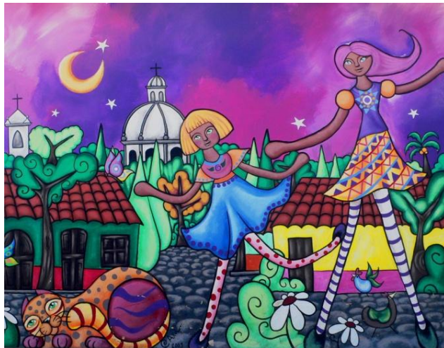
Mural, Ataco, departamento de Ahuachapán.

XXXII Congreso Nacional de Cardiología II Symposium Centroamericano y del Caribe de Ecocardiografía ECOSIAC